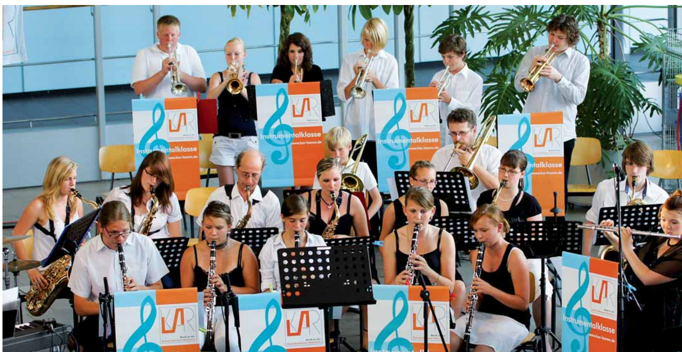
Bigband spielt zur Abschlussfeier

An der KAR hat sich über die Jahre ein Förderkonzept bewährt, das neben dem „klassischen Förderunterricht“ auch den Einsatz von Tutorinnen und Tutoren vorsieht, die aus den oberen Klassen oder regelmäßig von einem Berufskolleg in die Schule kommen. Die Schülerinnen und Schüler werden altersgerecht zu selbstständigem Lernen angehalten. Bibliothek und Mediothek liefern als „Selbstlernzentrum“ gute Arbeitsvoraussetzungen.